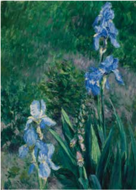
GAUCHE: GUSTAVE CAILLEBOTTE Iris bleus, jardin du Petit Gennevilliers huile sur toile, 1892, 21 ¼ x 18 ¼ po Vendue le 23 novembre 2016 pour 678 500 $