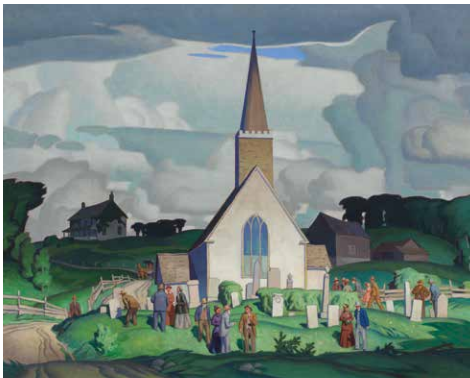
ALFRED JOSEPH (A.J.) CASSON