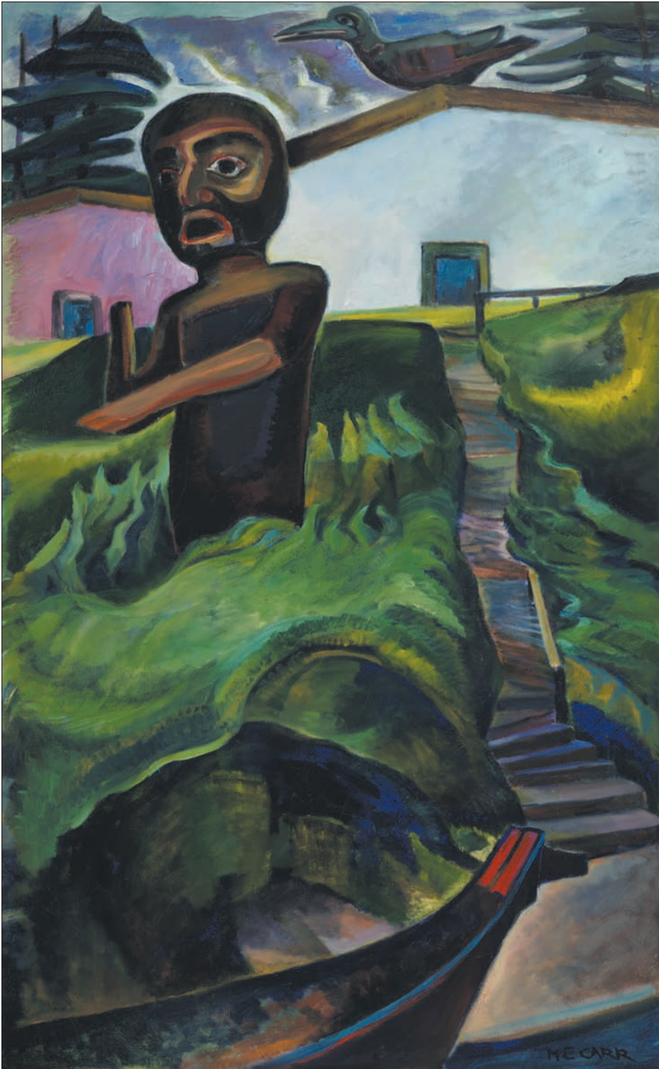
EMILY CARR, The Crazy Stair (The Crooked Staircase) huile sur toile, circa 1928 ~ 1930, 43 3/8 x 26 po Vendue 28 novembre 2013 pour le prix record de 3 393 000 $