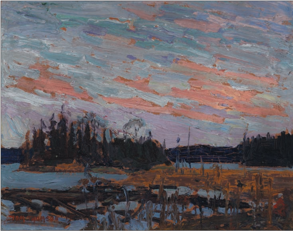
THOMAS JOHN (TOM) THOMSON, Canoe Lake , huile sur panneau, 1915, 8 1/2 x 10 5/8 po Vendue 28 novembre 2013 pour 1 696 500 $