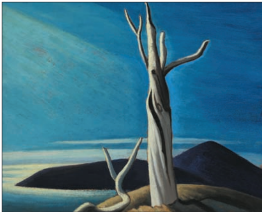
LAWREN STEWART HARRIS, Lake Superior Sketch LXI , huile sur panneau, 12 x 15 po • Sera offert lors de notre vente en salle du 28 mai 2014

Nous acceptons présentement les consignations pour notre vente en salle du printemps en deux séances d'Art canadien d'après-guerre et contemporain et de Beaux-arts canadiens.