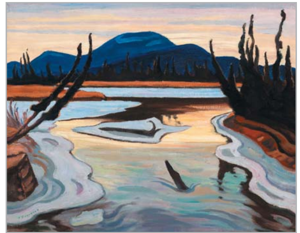
ALEXANDER YOUNG (A.Y.) JACKSON

Fondée à Vancouver, Colombie-Britannique, la Maison Heffel de vente aux enchères de beaux-arts a réalisé les 11 ventes aux enchères en salle de plus haut niveau d'art canadien. Elle est menée par une équipe expérimentée de spécialistes de beaux arts et a une présence à l'échelle nationale avec des bureaux à Vancouver, à Toronto, à Ottawa, à Montréal et à Calgary. En sa qualité de chef de file dans son domaine, la Maison Heffel détient plus de 60 pour cent des parts de marché des ventes aux enchères d'art canadien dans le monde, avec plus de 275 millions $ de ventes aux enchères d'art depuis 1995. La Maison Heffel publie toutes ses enchères en salle en ligne à www.heffel.com , de la promotion initiale et des listes illustrées des lots jusqu'à la diffusion en direct par caméras multiples et les résultats définitifs des ventes. La Maison Heffel présente les oeuvres d'art de ses clients avec respect dans ses catalogues imprimés, dans des présentations en ligne et lors d'expositions dans tout le Canada, et rejoint ainsi une vaste base de clients nord-américains, asiatiques et européens. Sa minutie dans chaque détail, sa réputation de traiter des oeuvres de la plus haute qualité, rareté et provenance et, point d'une importance capitale, avec les estimations justes, produisent ses résultats remarquables.