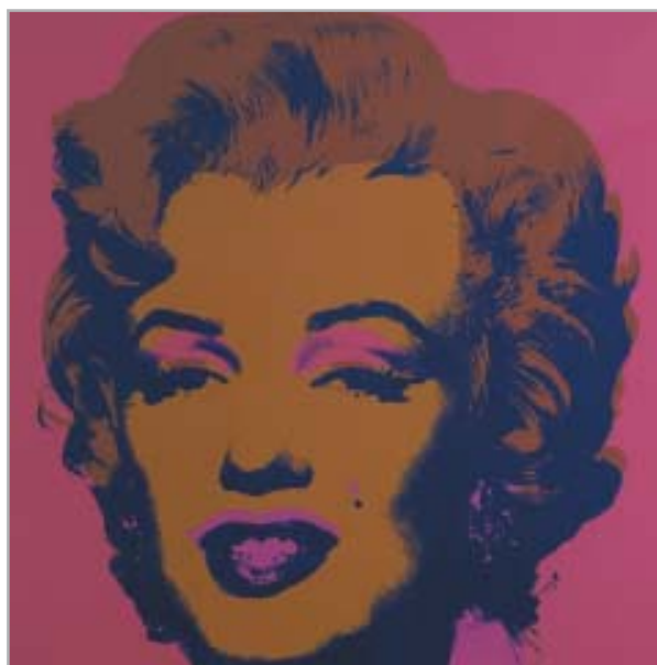
ANDY WARHOL, Marilyn (F. & S. II.27) sérigraphie, 1967, 36 x 36 po ESTIMATION: 50 000 $ ~ 70 000 $

Nous acceptons présentement les consignations pour notre vente en salle de l'automne en deux séances d'Art canadien d'après-guerre et contemporain et de Beaux-arts canadiens.