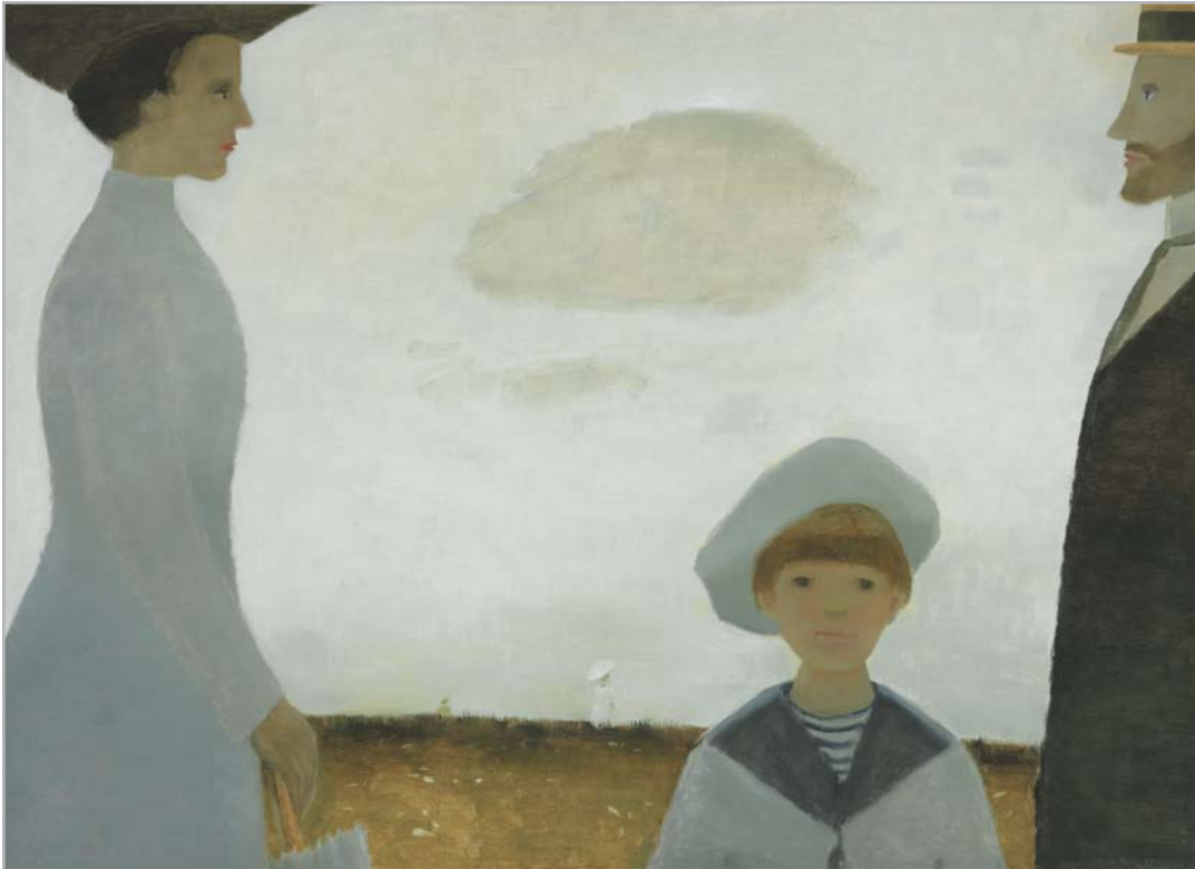
JEAN PAUL LEMIEUX Nineteen Ten Remembered

huile sur toile, 1962 42 x 57 1/2 po, 106.7 x 146 cm