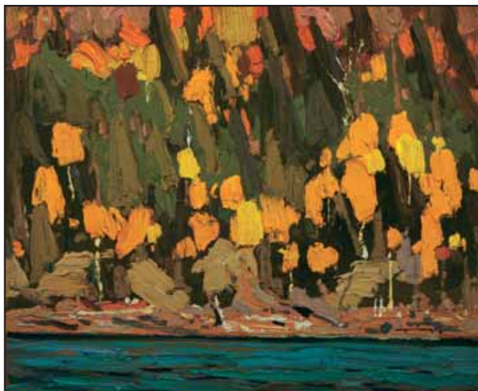
THOMAS JOHN (TOM) THOMSON