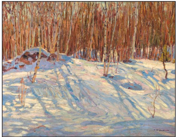
ALEXANDER YOUNG (A.Y.) JACKSON ALC CGP G7 OSA RCA RSA 1882 ~ 1974 CANADIEN

Vendue le 19 novembre 2008 pour le prix record de 163 800 $