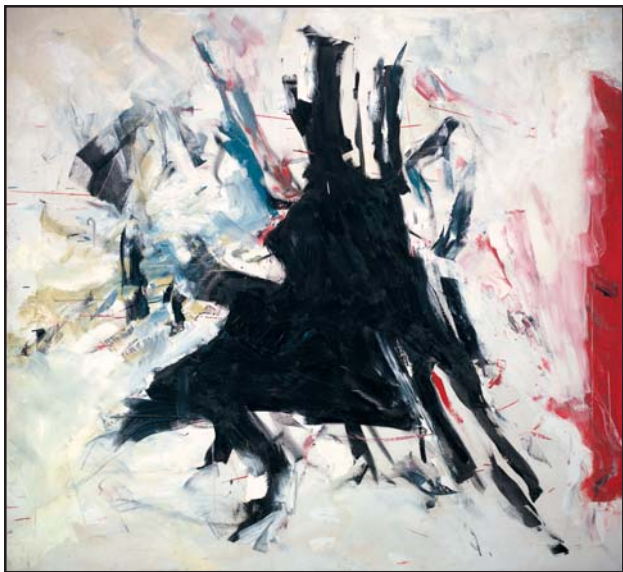
WILLIAM RONALD RCA 1926 ~ 1998 CANADIEN